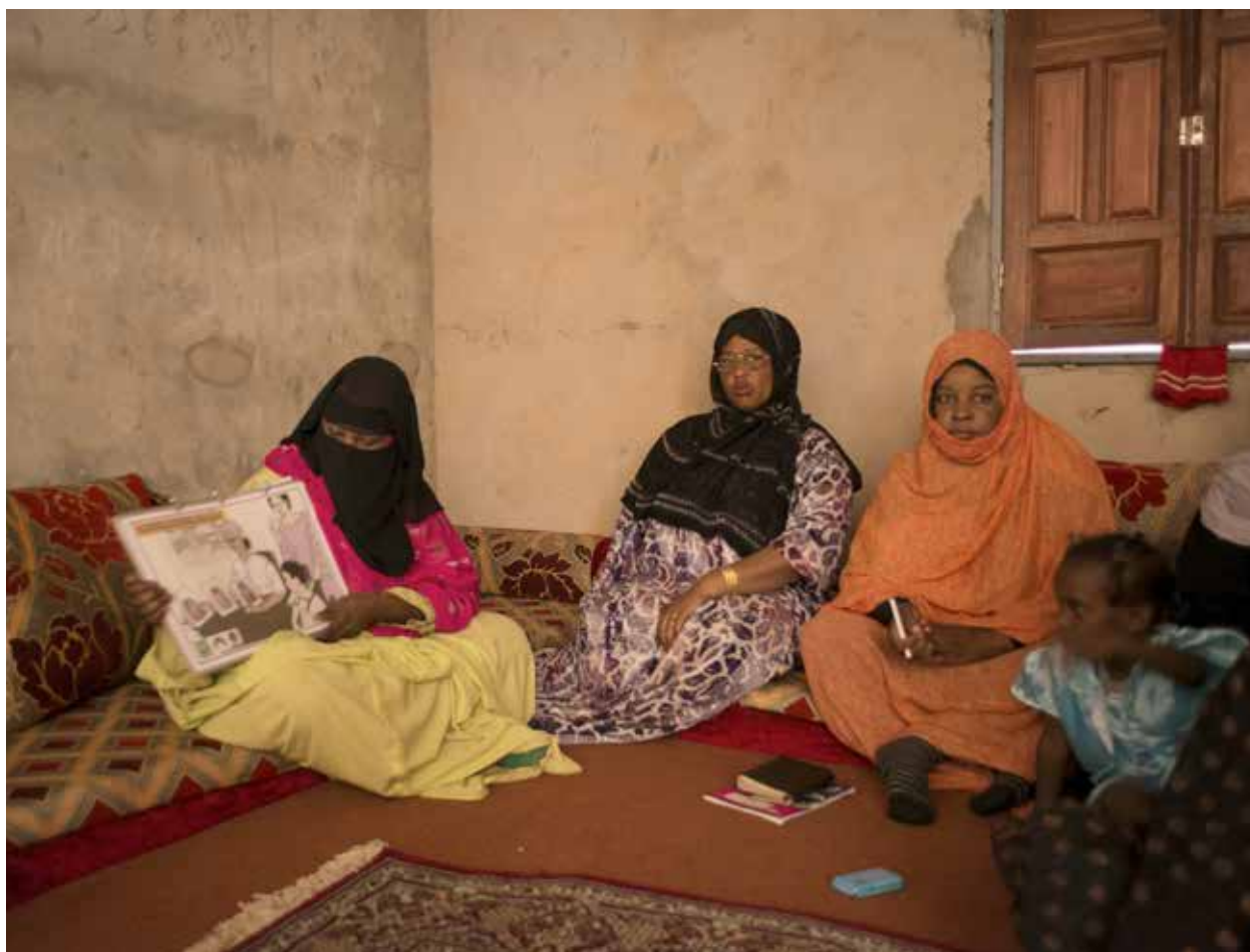
Appui OSC dans sensibilisation hygiène/ partenariat PSDN - LÉGENDE A COMPLÉTER PAR CARITAS MAURITANIE