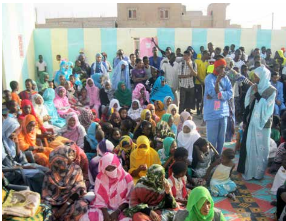
Environ 300 personnes du quartier, des jeunes, des femmes et des enfants pour la plupart, ont pu assister à des chants et des sketches lors de la soirée culturelle organisée par le projet à la maison des jeunes de Dar Naïm.

qu'ils rencontrent et tous les autres problèmes qu'ils constatent dans leur moughataa. Une fois les problèmes posés, ils ont proposé des actions pour les résoudre et une répartition des tâches entre la mairie, les jeunes et le PU. Ils ont finalement réussi à définir des objectifs communs qui devaient « parler » à l'ensemble des jeunes de Dar Naïm, peu importe la communauté d'origine.