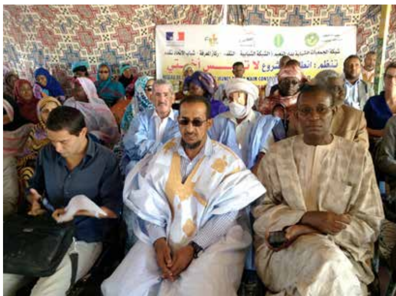
Séance de restitution lors de la rencontre inter-associations entre la commune de Dar Naïm, les associations de la commune et d'autres associations issues d'autres quartiers de Nouakchott.

Naïm ont pu échanger sur les problèmes rencontrés par les femmes et les solutions possibles. Il a été rappelé l'importance de l'éducation des femmes pour leur émancipation . À ce sujet, beaucoup de femmes ont témoigné de la difficulté d'obtenir les documents d'état civil , ce qui empêche les enfants d'aller à l'école : « on ne peut pas scolariser nos filles si celles-ci n'ont pas de certificat d'identité ». Les coopératives de Sebkhah ont sensibilisé les femmes de Dar Naïm sur la possibilité de démarrer une AGR sans financement externe mais avec seulement des cotisations internes. Les procédures pour obtenir la reconnaissance formelle d'une coopérative ont également été développées. Les représentants de l'APSDN et de Djikké ont présenté la Mutuelle de santé et la caisse de Djikké de Dar Naïm. Une fille d'une association de jeunes a déclaré que cette journée l'a motivée davantage pour s'investir dans le milieu associatif malgré certains freins (pressions sociales, etc.). Elle proposait de créer un cadre d'échanges avec les parents (parce qu'il est mal perçu pour certains de voir une fille dans le milieu associatif). Aujourd'hui cette jeune fille fait partie de l'équipe opérationnelle du projet « Touche pas à ma sœur ».