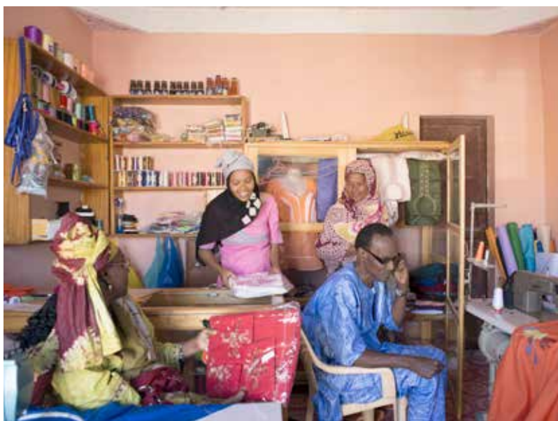
LÉGENDE A COMPLÉTER PAR CARITAS MAURITANIE