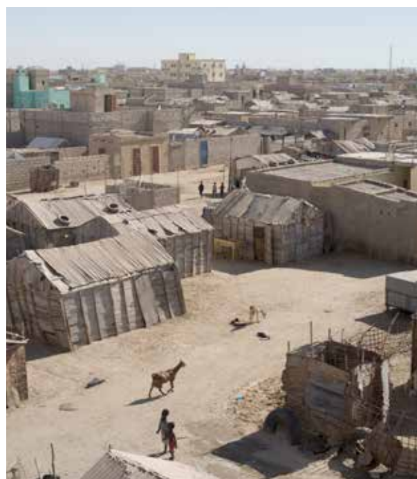
LÉGENDE A COMPLÉTER PAR CARITAS MAURITANIE

Sur le projet de Dar Naïm, l'approche d'origine dite intégrée a évolué ; elle est allée au-delà de l'objectif de développement des structures locales ou