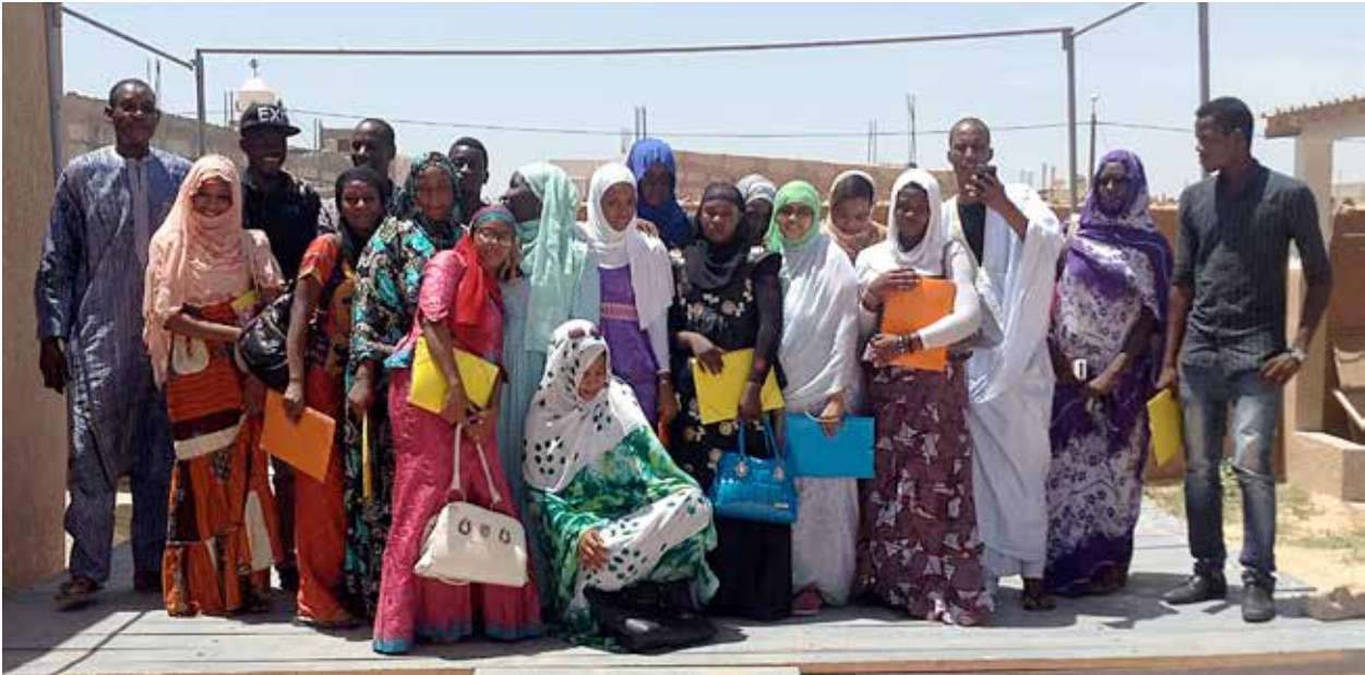
LÉGENDE A COMPLÉTER PAR CARITAS MAURITANIE