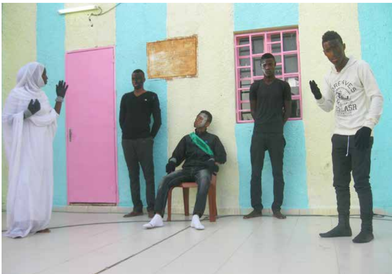
Atelier de sensibilisation d'un groupe de jeunes auprès de la population de Dar Naïm dans le cadre du projet « Touche Pas A Ma Soeur » afin de lutter contre les discriminations de genre.

Il est très difficile de connaître le nombre exact de jeunes de Dar Naïm qui ont participé aux activités. Beaucoup sont des activités de masse pour lesquelles il n'est pas possible de définir le nombre exact de participants. De plus, certains jeunes ont participé à plusieurs activités du projet. Nous pouvons estimer ce chiffre à environ 30 % de la population de Dar Naïm âgée de moins de 35 ans.