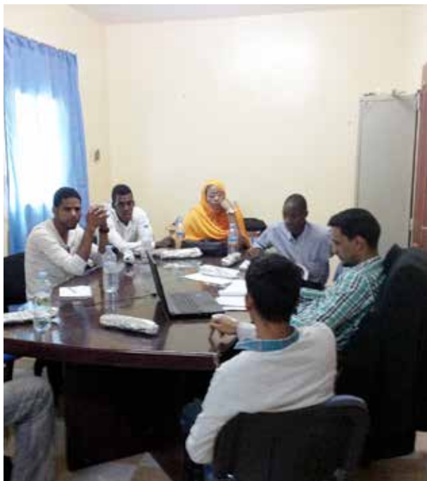
Réunion de débriefing avec les jeunes formés en maintenance informatique suite à une visite en entreprise pour mieux comprendre la structure et ses différentes activités.

Après les différentes formations, les jeunes ont développé des activités génératrices de revenus (AGR). Parmi elles nous pouvons citer : les boutiques de vente de voiles et produits cosmétiques, la boutique de vente de cartes téléphoniques, la boutique de réparation du matériel informatique... Des formations en gestion administrative et techniques de vente leur permettront de mieux s'outiller afin de réussir leurs projets.