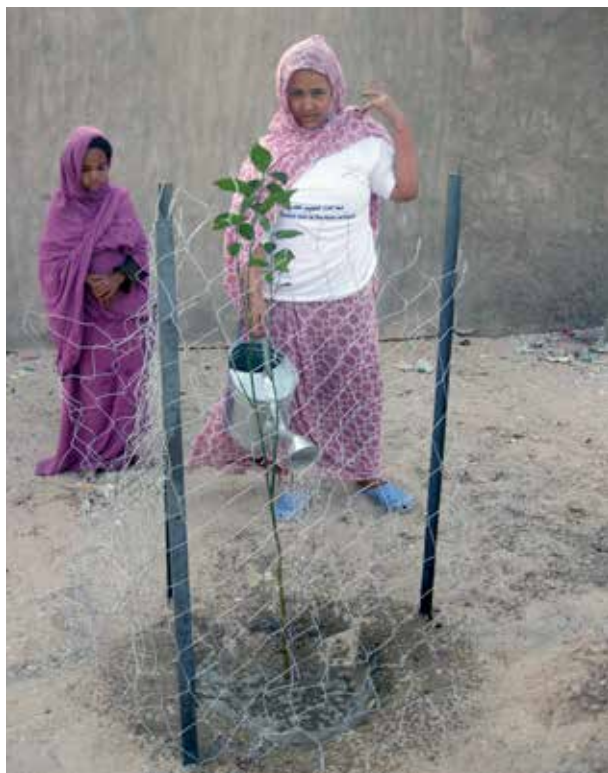
Dans le cadre d'un des micro-projet citoyen, 50 arbres ont été plantés dans les rues de Dar Naïm.

Dans un troisième temps, il a été demandé à chaque