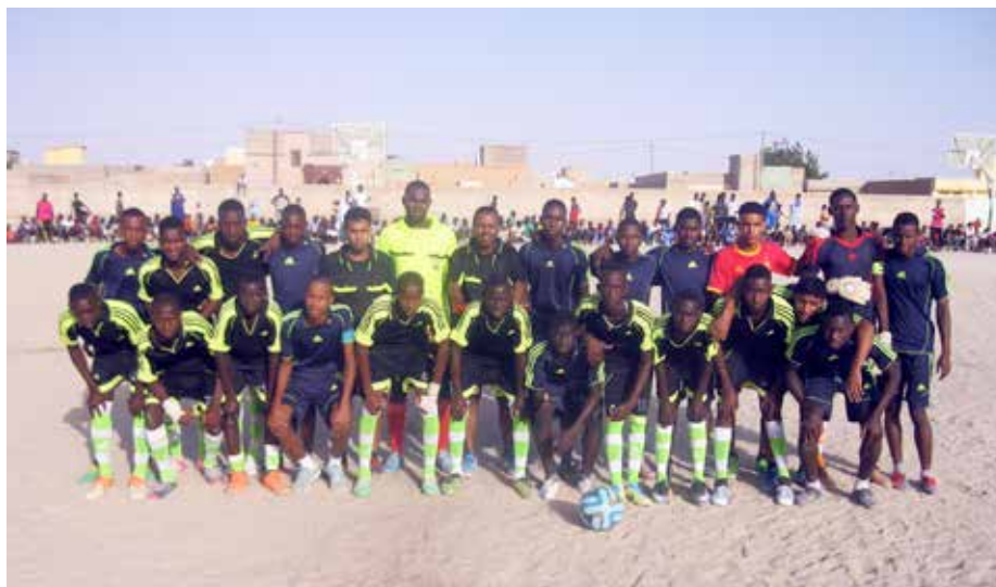
Une équipe des deux sélections de Dar Naïm lors du match de la « coupe du maire ». Ce sont les jeunes mobilisés dans le cadre du projet qui ont eux même organisé cet évènement à travers la création d'une commission spéciale de membres d'associations sportives du quartier.

membres des deux commissions ont défini le thème de la manifestation, « Ma commune, mon affaire », thème qui deviendra le slogan de toute activité du PU avec la jeunesse. La commission sensibilisation a défini les moyens de communiquer sur cette évènement (voiture sonorisée, affiches, banderoles, flyers, cartes d'invitation). La commission organisation a défini les activités à mener, les artistes et le contenu des messages : sketch, théâtre et rap sur fond de sensibilisation autour des valeurs de citoyenneté, de la promotion de l'éducation, de la tolérance et de la santé. Les activités culturelles sont des vecteurs forts de sensibilisation en Mauritanie. Les footballeurs du groupe de jeunes se sont entendus pour organiser un match de football en ouverture de cette journée, entre une équipe de DAR NAIM NORD et une équipe de DAR NAIM SUD. Ils ont eux-mêmes organisé la sélection des joueurs des deux équipes. La soirée culturelle a eu lieu juste après la rencontre sportive. L'évènement a remporté un grand succès avec la présence de beaucoup de jeunes et d'enfants. Les autorités de Dar Naïm (mairie et inspection départementale et régionale de la jeunesse et des sports), la direction de Caritas Mauritanie et un représentant du Service de coopération et d'action culturelle (SCAC) de l'ambassade de France étaient également présents.